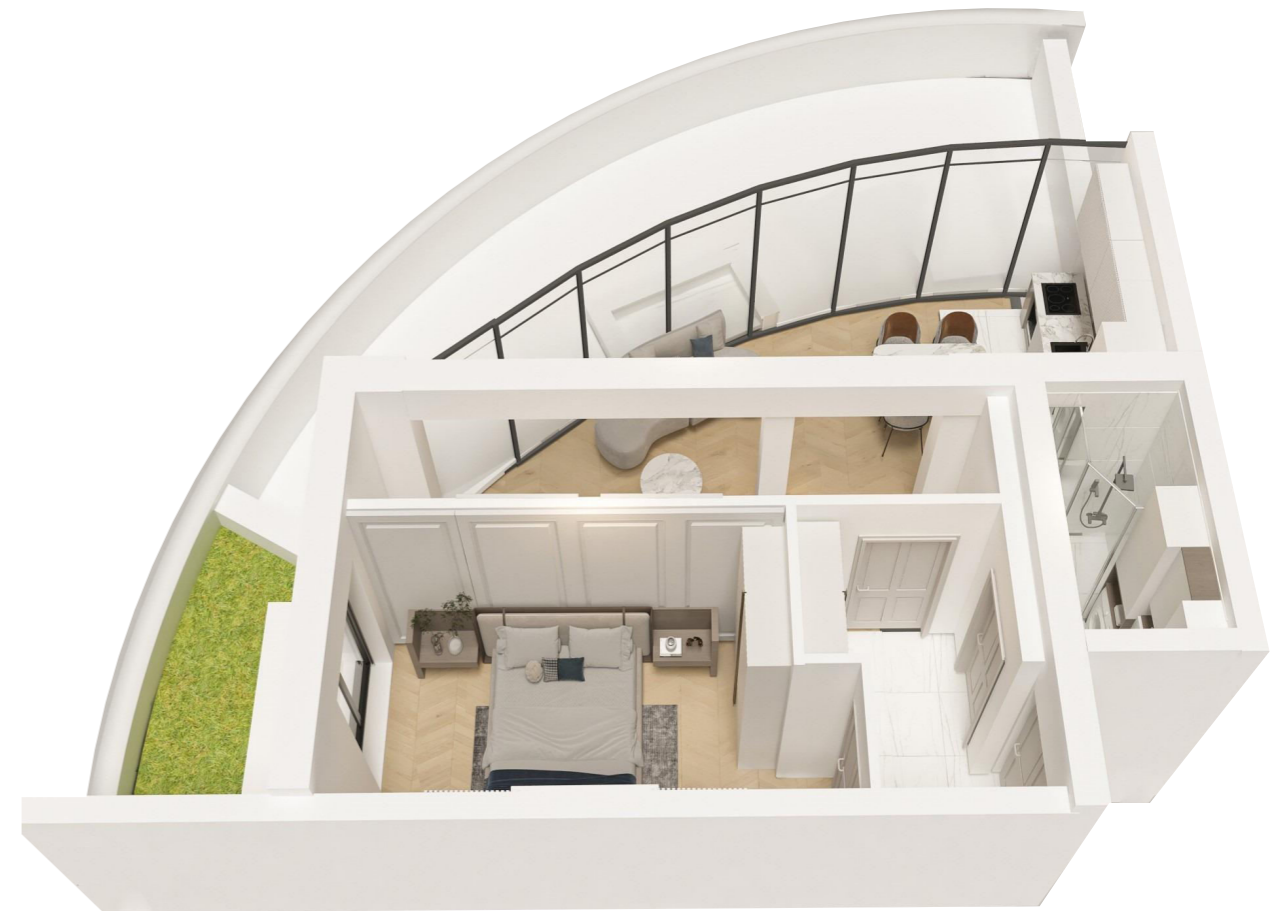
3D MODEL STANA